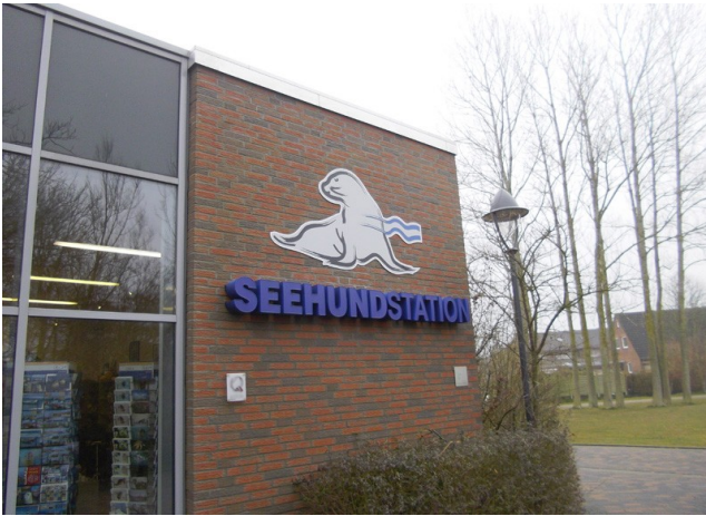
Station d'élevage de phoques