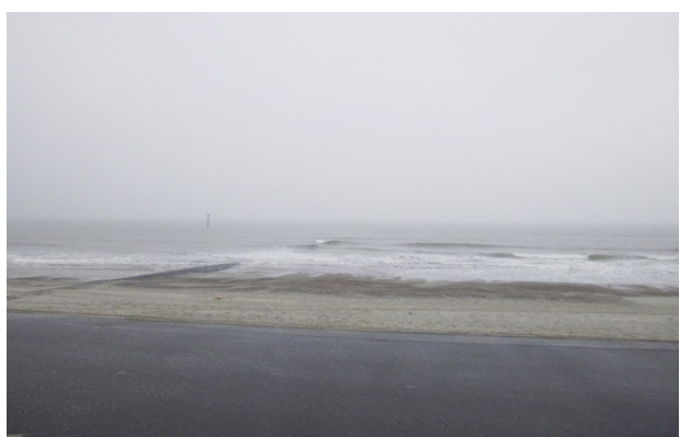
La Mer du Nord sous la brume et le vent