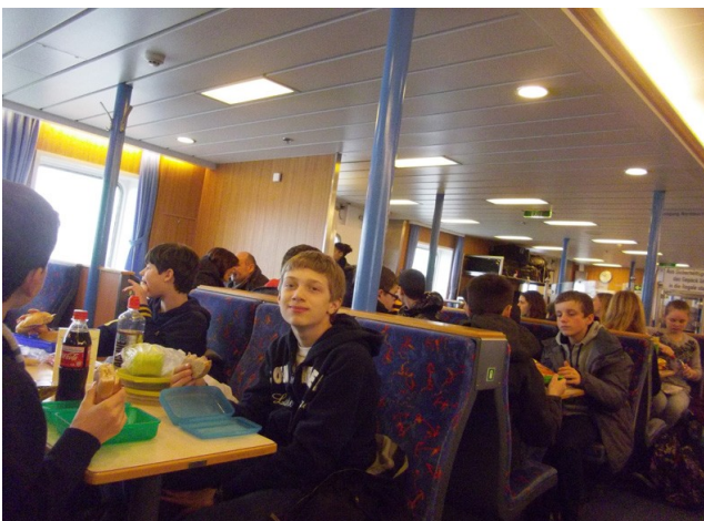
Pique nique à bord du Ferry