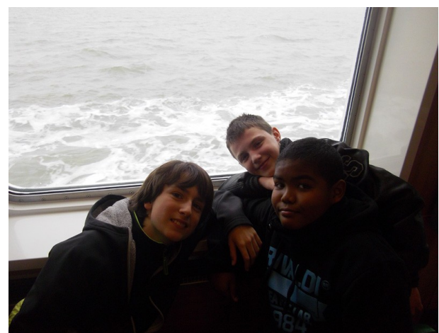
Ce jour-là on est mieux en cabine que sur le pont !!