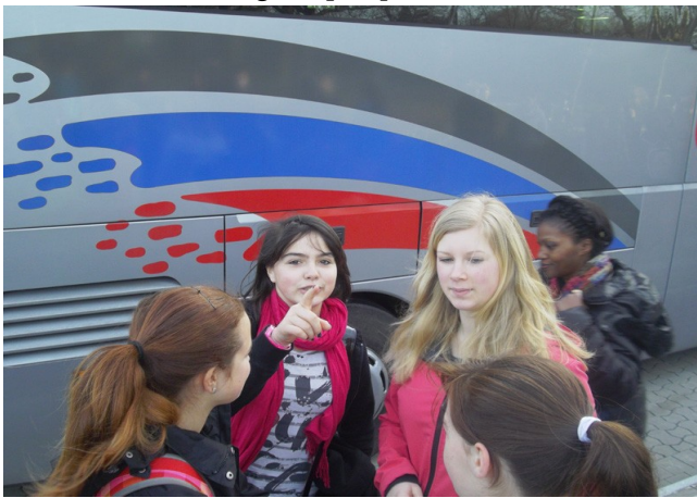
En route pour l'île de Norderney