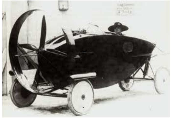
Photo de l'Hélica de l'époque de son apparition.